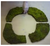
④成形スナゴケ スベアゴケ有 別途販売