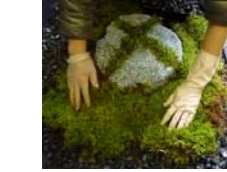
⑦石溝の苔と外部の苔を圧着して馴染ませる。