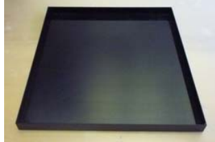
①場所選び後、ケースを固定