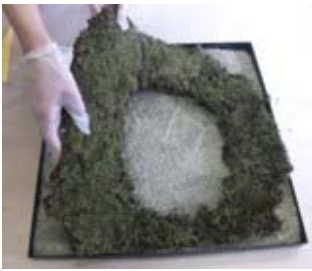
⑤成形スナゴケを敷く チギレやすいので丁寧に扱う 端切れがでた場合は圧着する