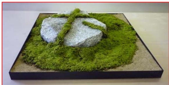
⑨完成 あとは自然に任せる