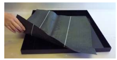
③防根シートを敷く