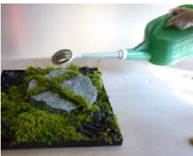
⑧最初の一回だけ水を十分に与える