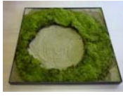
⑥コケ入り石を 成形コケに 合わせて置く