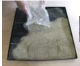
④砂を平均して撒き ヘラなどでならす